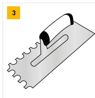
Hladítko so zubom 15 mm - vhodné pre dosky 150 mm a viac