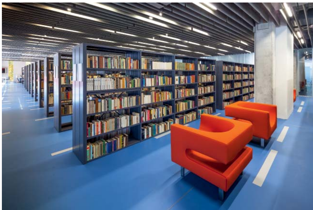
Dobry základ: zbierkový fond v moderne zariadenej a prekladne členenej knižnici pojme až 700 000 zväzkov.

K atolícka univerzita v Ružomberku vznikla v roku 2000 a jej založeniu predchádzala séria diskusií, kde by malo nové centrum vzdelávania vzniknúť. Hoci Trnava mala na svojej strane argument, že tu univerzita existovala už v 17. storočí, a Košice mohli nadviazať na tradíciu jezuitského seminára, prednosť dostal práve Ružomberok. Mesto bývalo významným finančným a priemyselným centrom, v socialistických časoch sa však dostalo na okraj. Po stránke urbanizmu a architektúry sa tu podpísala nielen táto éra, ale tiež nekonceptné riešenie stavebnej činnosti v posledných