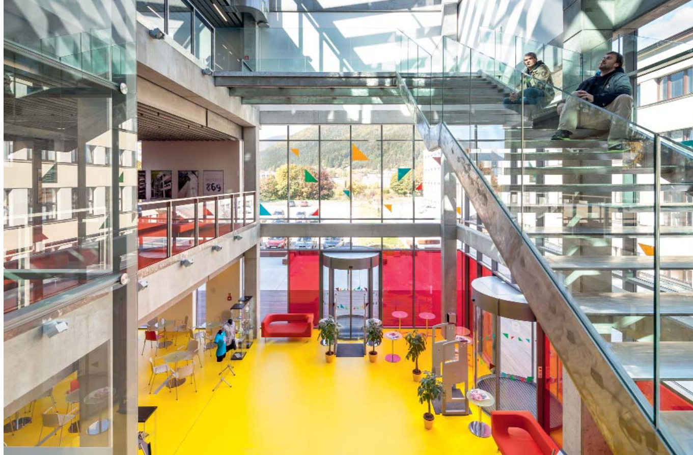
Priestorové plány: farebne odlíšené galérie knižnice sa otvárajú do svetlom vyplneného vstupného vestibulu.