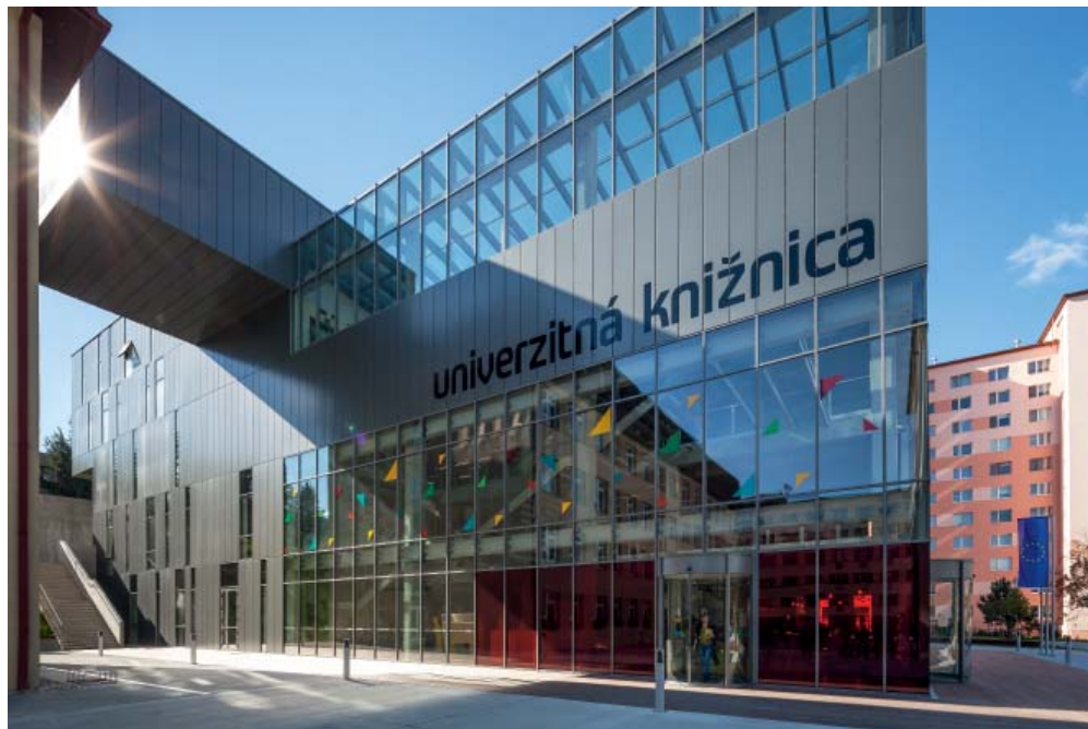
Odkaz priemyselnej minulosti: strobú fasádu knižnice tvoria rozsiabie zasklené plochy a metalický obklad. Prispievajú k celkovému industriálnemu dojmu stavby.

a ukazuje, akým smerom by sa urbanistický vývoj mesta mohol rozvíjať.