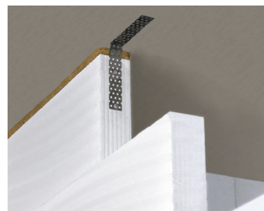
Dodatočné ukotvenie k nosnej konštrukcii pomocou klinčov s nehrdzavejúcou povrchovou úpravou, alebo pomocou skrutiek a hmoždieniek