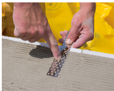
Priebežné vkladanie murivovej spojky do ložnej škáry