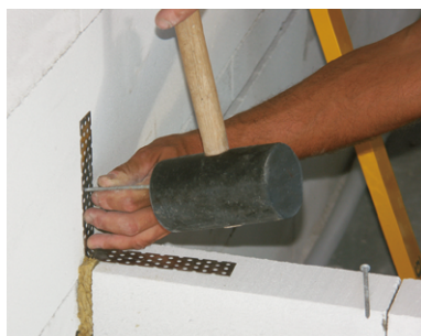
Dodatočná montáž murivovej spojky